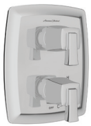
Townsend MD TU353740