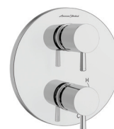
Serin MD TU064740