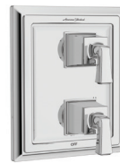
Town Square MD S TU455740