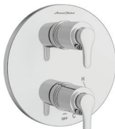
Studio MD S TU105740