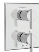
Times Square MD TU184740